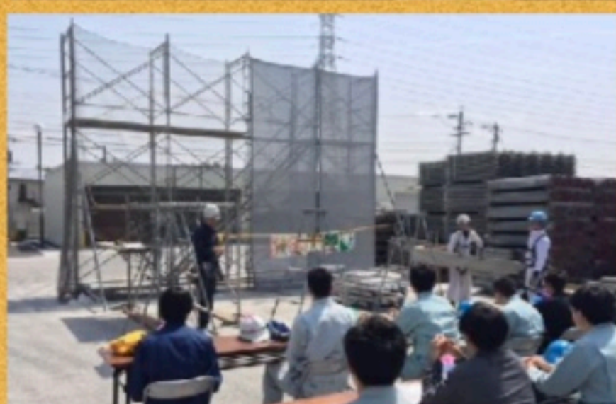
合同説明会 5/20 5/23